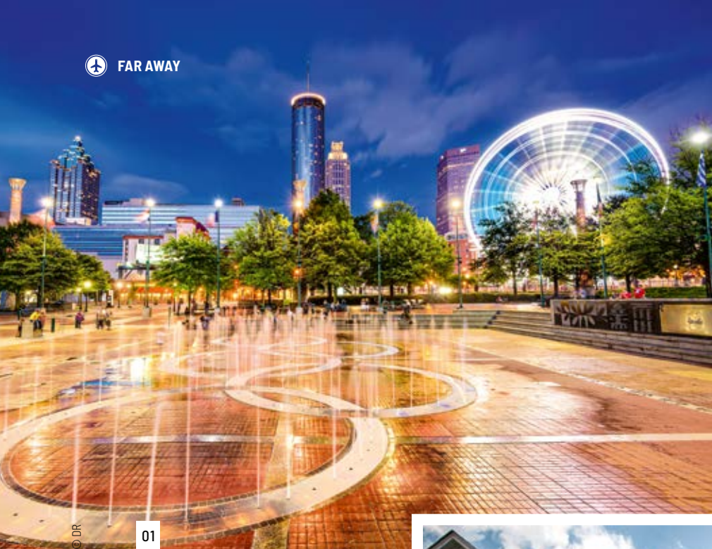
01/ Le Centennial Olympic Park. The Centennial Olympic Park.