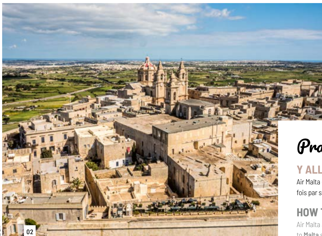
01/ Lagon bleu, Comino Blue Lagoon, Comino

Exuberant and colourful, Malta is bursting with a sense of celebration: its pastizzi, small puff pastries stuffed with ricotta or pea purée, a speciality to be enjoyed on many of its café terraces, swimming in crystal-clear creek waters, boat tripping, surfing, kayaking, scuba diving and hiking through breathtaking landscapes, such as the spectacular cliff-views around the town of Dingli. Its many festivals, include the Festa Frawli (Strawberry Festival) and the internationally famous musical gathering, the Isle of MTV, as well as a host of village festivals that pulsate all summer long, and finally of course, the Island's signature occasion, the Malta International Fireworks Festival. ✈